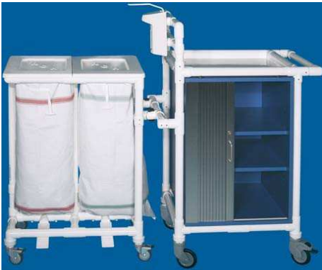
MPC 362 MRSA