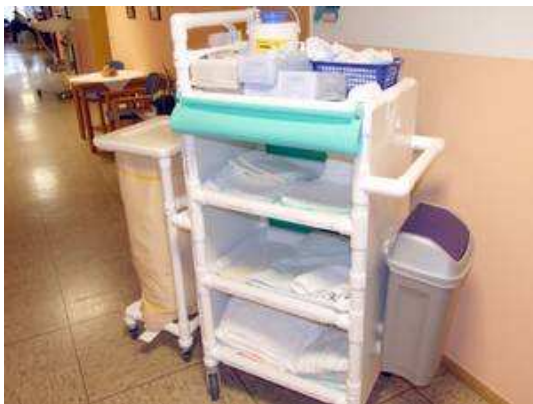
MC 340 MRSA