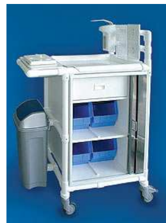
MDC 400 MRSA: Sonderbau auf Kundenwunsch