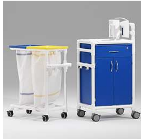
MPC 372 S MRSA