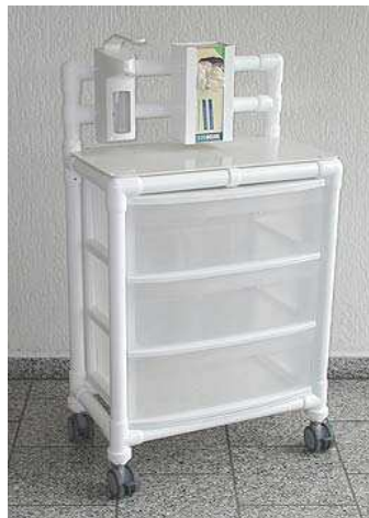
Hygienewagen HGW 100