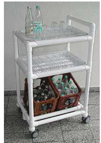
Getränkewagen GTW 100