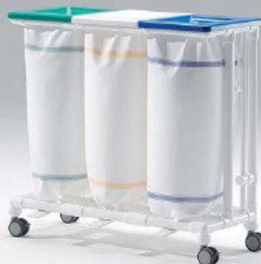
SLH 023 FP Wäschesammler • drei Abwürfe • mit Fußpedalen FP