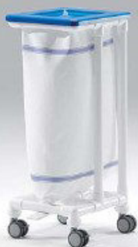
SLH 021 FP Wäschesammler • ein Abwurf • mit Fußpedal FP