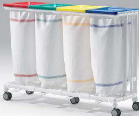
SLH 024 FP Wäschesammler • vier Abwürfe • mit Fußpedalen FP