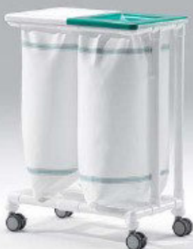
SLH 022 Wäschesammler • zwei Abwürfe